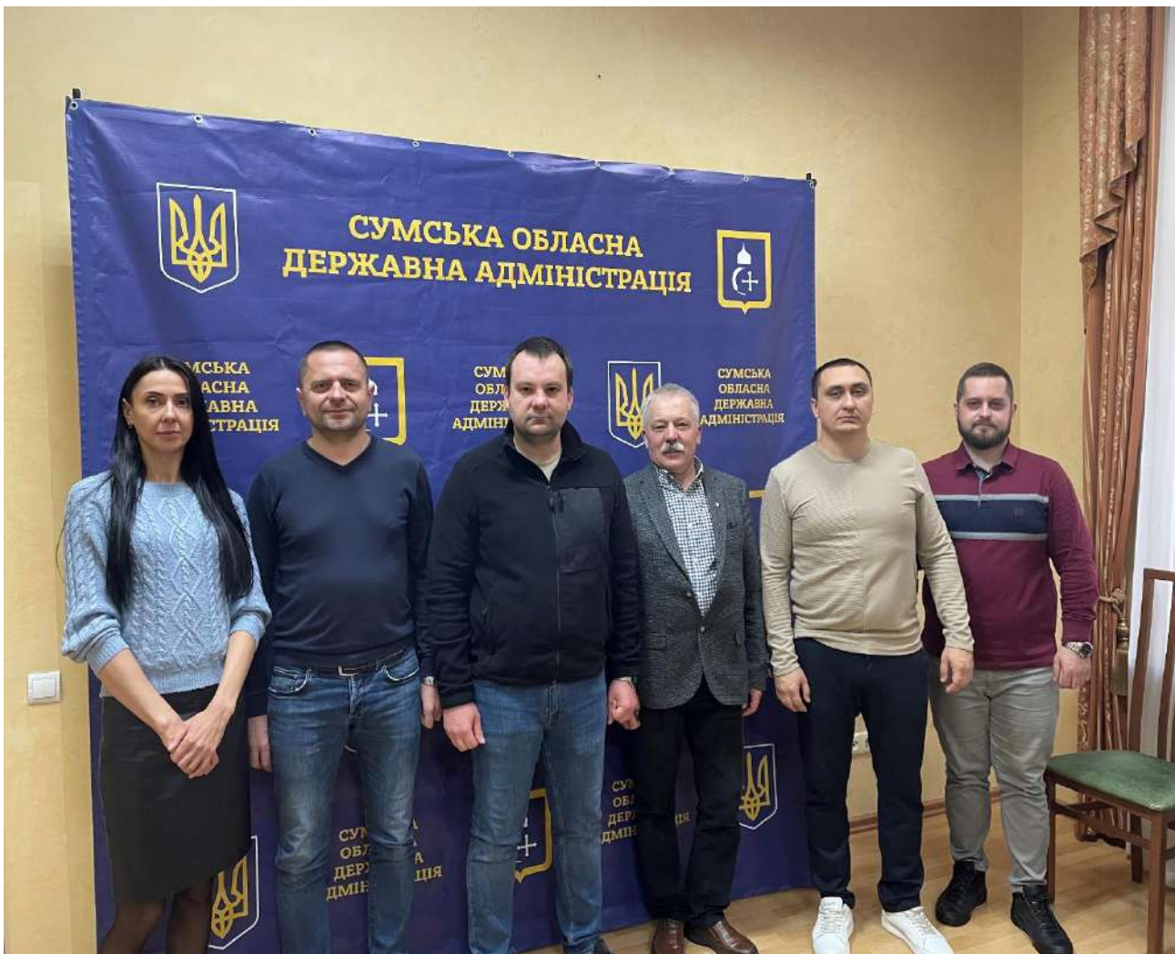
Зустріч з керівництвом Сумської ОВА

Надано гуманітарну допомогу продуктовими наборами для харчування та гігієни 2 тисячам ВПО які потерпіли внаслідок війни у 5 громадах Сумської області: Великописарівська ТГ, Миропільська ТГ, Новослобідська ТГ- Шалигінська ТГ, Зноб-Новгородська ТГ та у 5 громадах Чернігівської області: Сосницька ТГ, Дмитрівська Новгород-Сіверська, ТГ Срібнянська ТГ, Іванівська ТГ. Донорська організація - Delegation of the Danish Refugee Council in Ukraine(DRC). Дія проекту - 15.10.2022-30.03.2023. Сума проекту – 60 400,00 доларів США