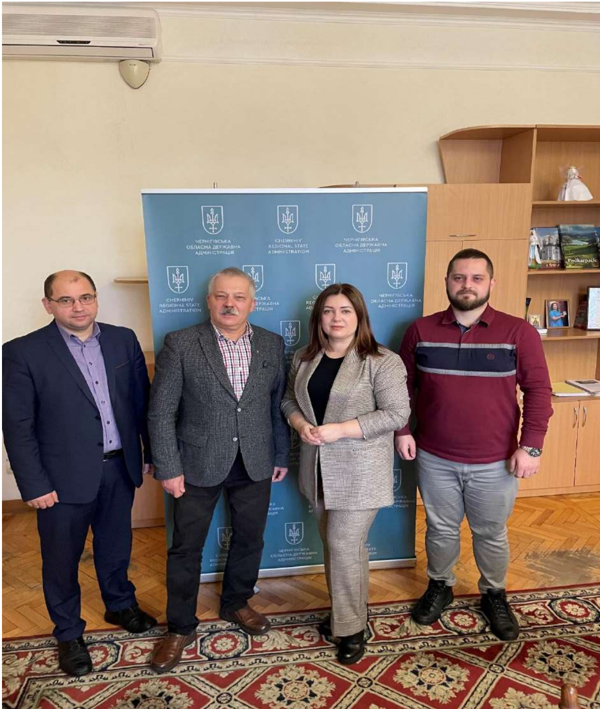
Зустріч з керівництвом Чернігівської ОВА