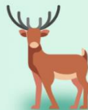
м'ясо диких тварин та диких тварин, вирощених на фермі